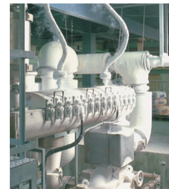
低温粉碎プラント

物質にはある温度以下になると急激に脆くなる性質があり、常温では粉碎しにくいゴム、プラスチック類など、多様なニーズに対応しています。低温粉碎した粉末は、「流動性に優れる」「熱による変質がない」「酸化劣化が少ない」などの特徴があり、低融点物質や油分、水分を含んだものも粉碎可能なため、様々な用途に使用されています。