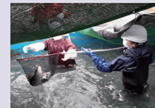
トラウトサーモン水揚げ

1期目(2021年11月~2022年6月)の3倍程度となる約9,000尾を導入し、2023年5月~6月にかけて大手スーパーなどで販売しました。試験結果等を踏まえ、事業化に向けて検討を進めています。