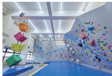
ボルダリングジム

東邦不動産(株)が運営する「邦和みなと スポーツ&カルチャー」に、2022年5月、ボルダリングジムを開設しました。初心者向けウォールや高さ約6.5mのクライミングウォール、東海地方初のキューブ型アトラクションウォールを備えており、お子さまから大人まで地域の皆さまにご愛顧いただいています。